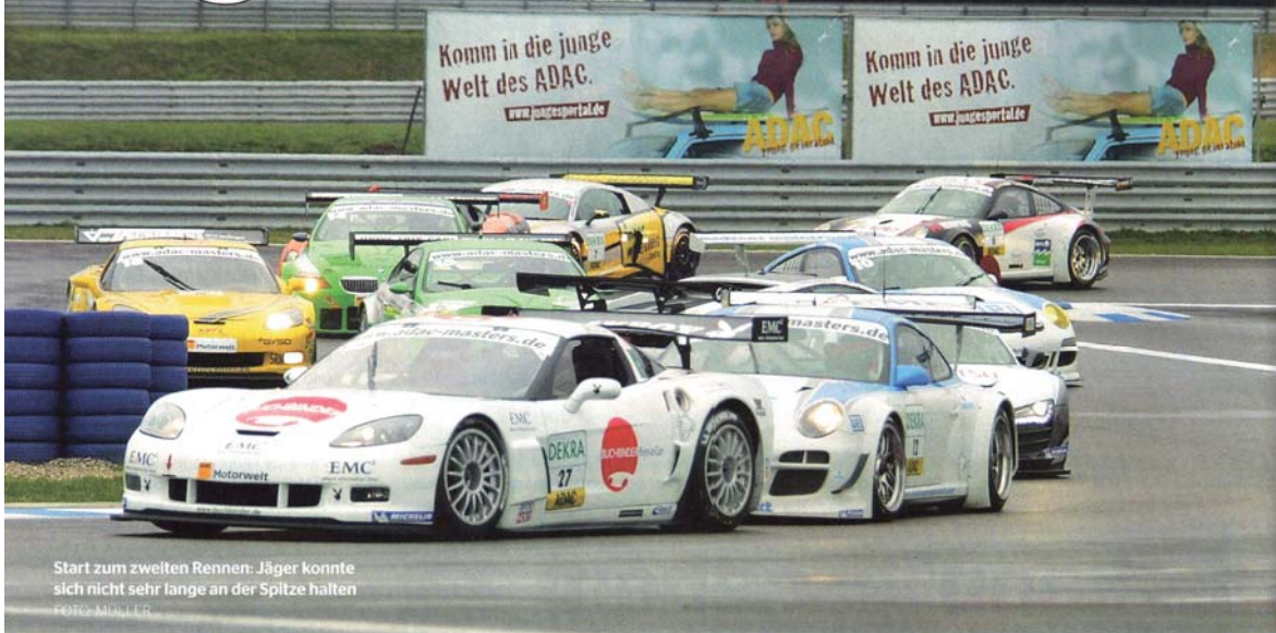
Start zum zweiten Rennen: Jäger konnte sich nicht sehr lange an der Spitze halten