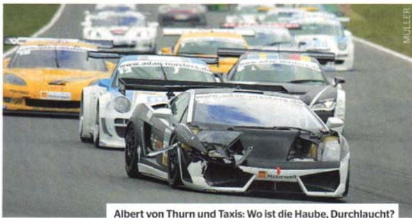
Albert von Thurn und Taxis: Wo ist die Haube, Durchlaucht?